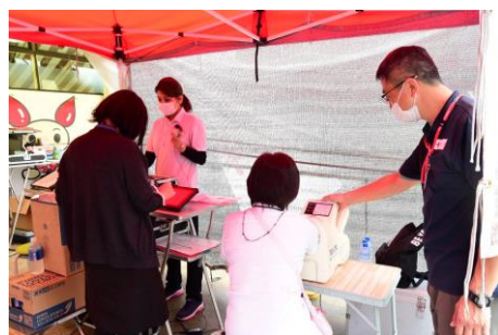
献血前には血圧測定などを行います