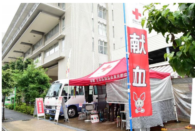
献血会場（病院正面駐車場横）