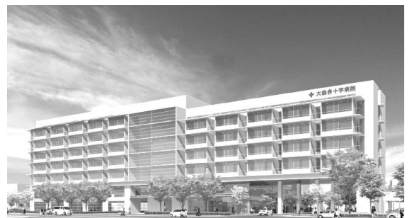
新病院完成イメージ図

なお、 工事期間中も、現病院で入院・外来ともに従来どおり続けて診療を行います ので、皆様方には、変わらずご利用いただきますようお願いいたします。