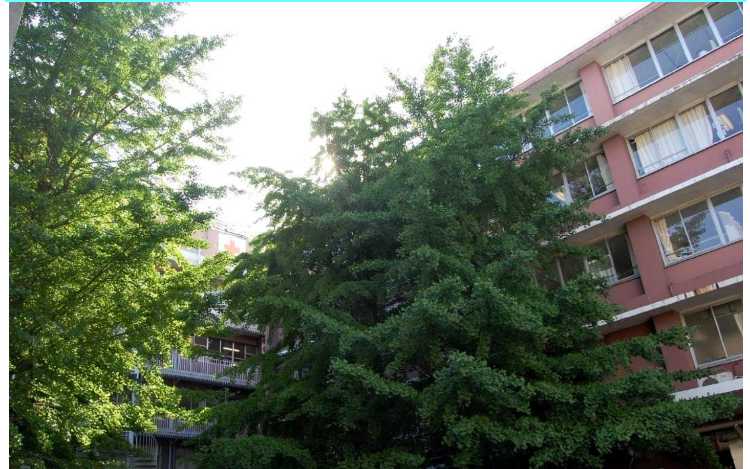
中庭のイチョウ 6/23 撮影