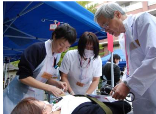
搬送された傷病者の治療にあたる医師・看護師