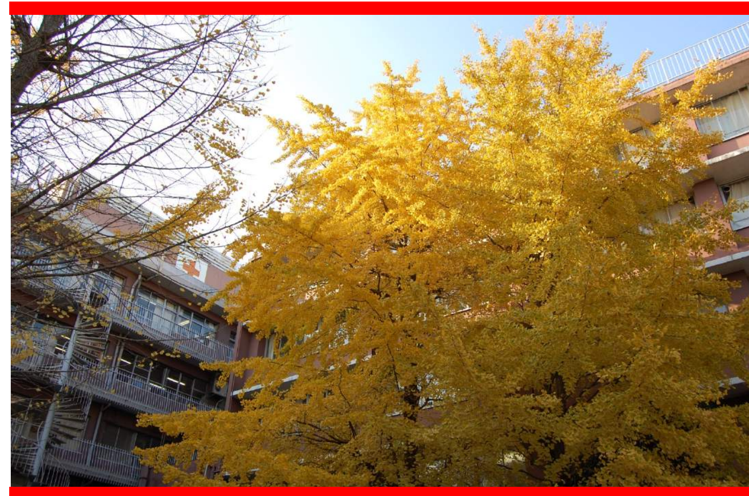
中庭のイチョウ 12/1撮影