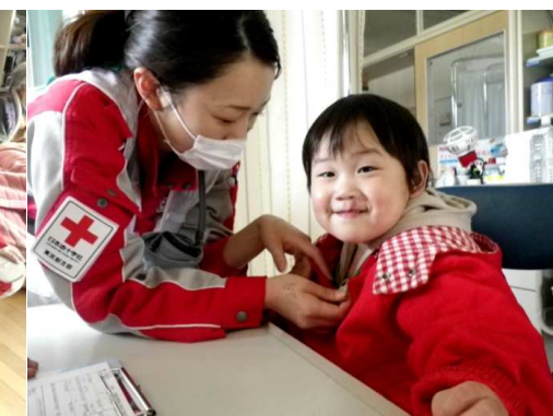
巡回先の小学校保健室での診察風景