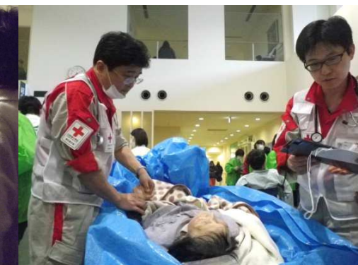
石巻日赤での診療