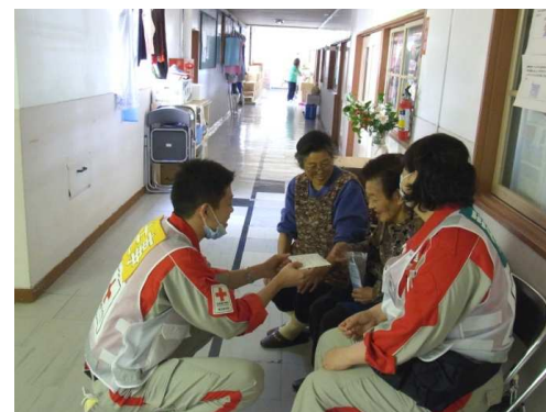
被災者と話しをする薬剤師と看護師