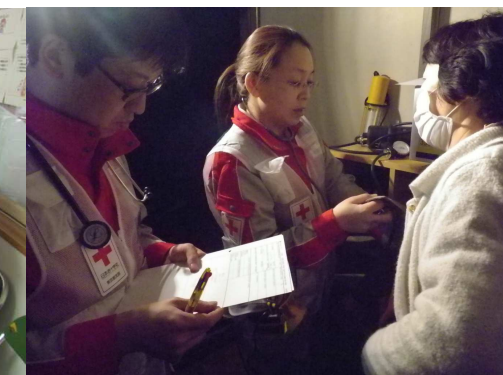
ライフラインが絶えた中での診療