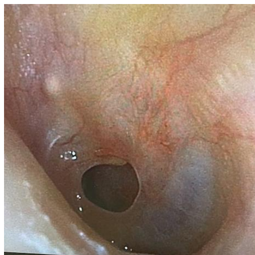
鼓膜に穿孔を認める

鼓膜穿孔のある慢性中耳炎や真珠腫性中耳炎に対して、以前は顕微鏡を用いて手術を行っておりましたが、近年は内視鏡下に手術を行う事が多くなってきております。全ての患者様に適応になる訳ではありませんが、より低侵襲な内視鏡下耳科手術を積極的に行う方針としております。