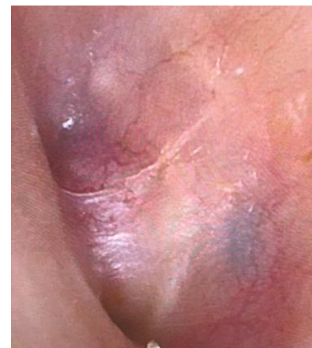
内視鏡手術 2ヶ月後 穿孔は認めない