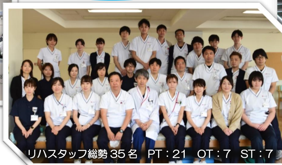
リハスタッフ総勢 35名 PT:21 OT:7 ST:7